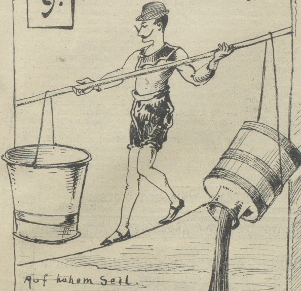
Auf hohem Seil.