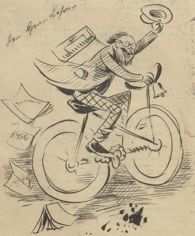
Lehrer: „Juhu, jetzt bin ich für vier Wochen die Stricke los!“