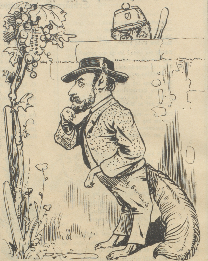
Der Fuchs möchte schon gern, aber die Trauben sind ihm alleweil doch zu teuer.