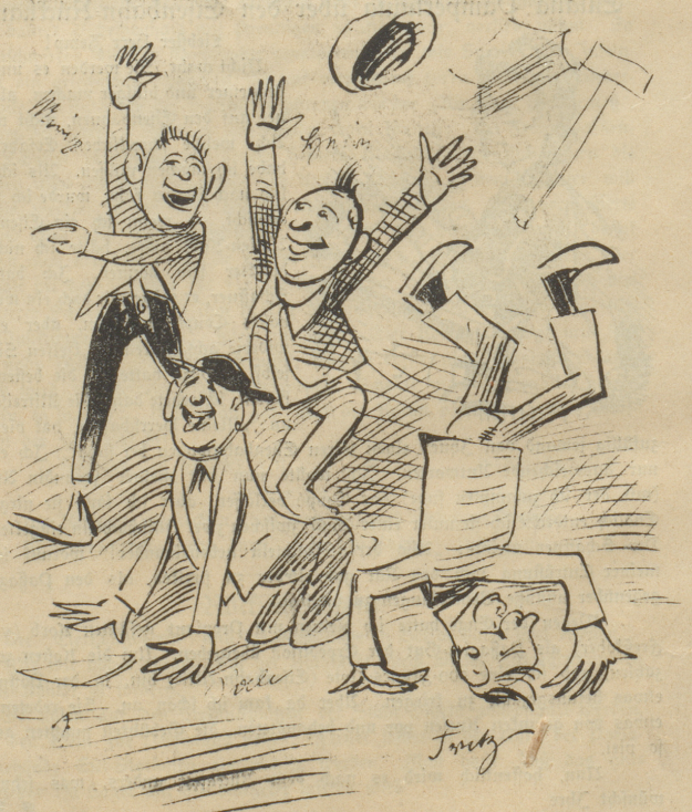
Schüler: „Juhu! Er häd ü endli i d'feria gstrichä!“