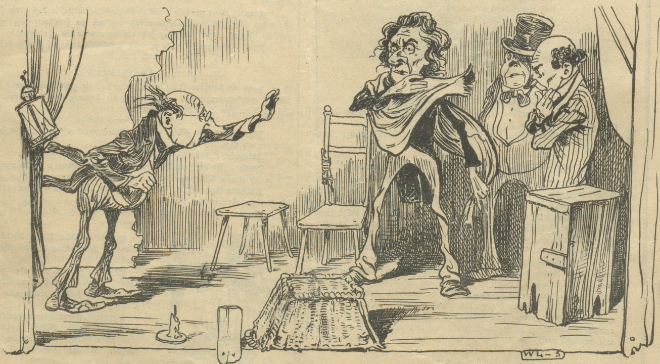
„Nanu, was sind denn das für zwei merkwürdige Kerle?“ „„Das sind zwei von den neuen Statisten, welche der Theater-Direktor nach neuer façon ausgebildet hat.““