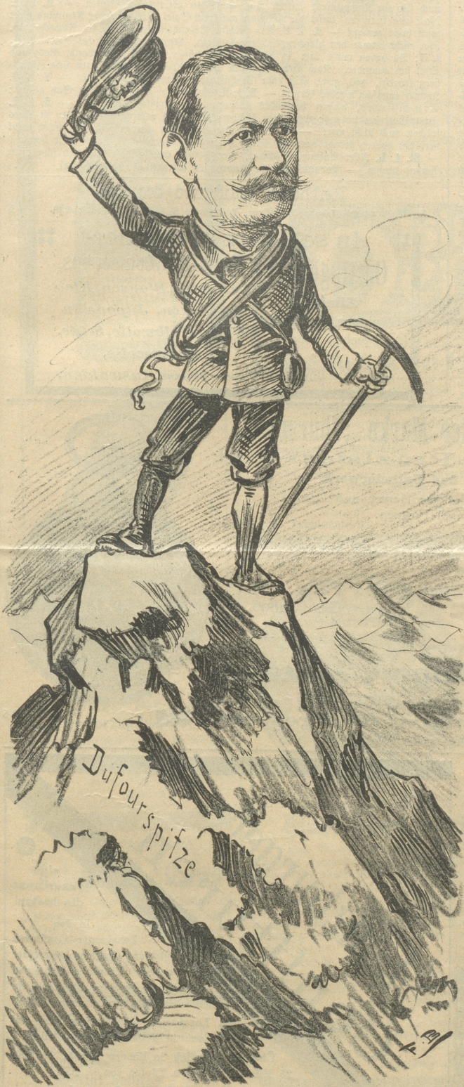
Bundespräsident Ruffy (auf der Dufourspitze): „Ich steh' auf einer höhern Warte, Als auf den Zinnen der Partei!“