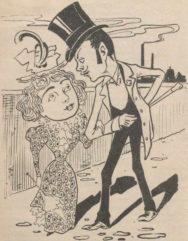
Mit dem Großen fängt man an;