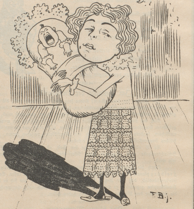
mit dem Kleinen hört man auf.