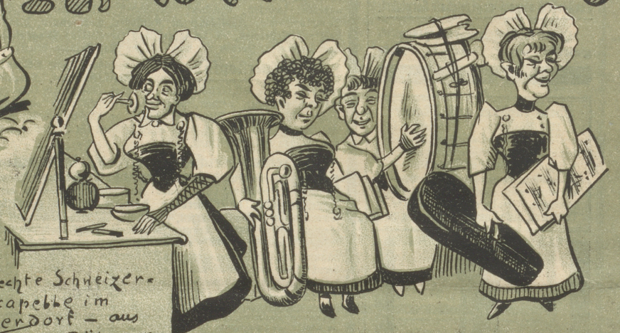
Aechte Schweizer-Damenkapelle im Schweizerdorf - aus Böhmen.