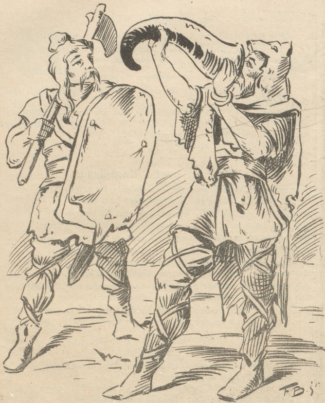
Die alten Schweizer tranken noch eins, ehe sie gingen.