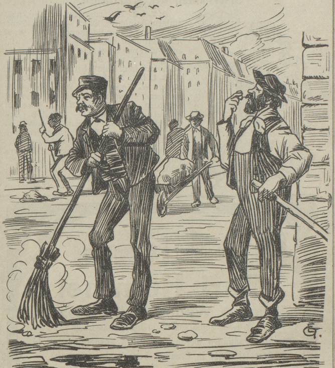
Corps de balai.