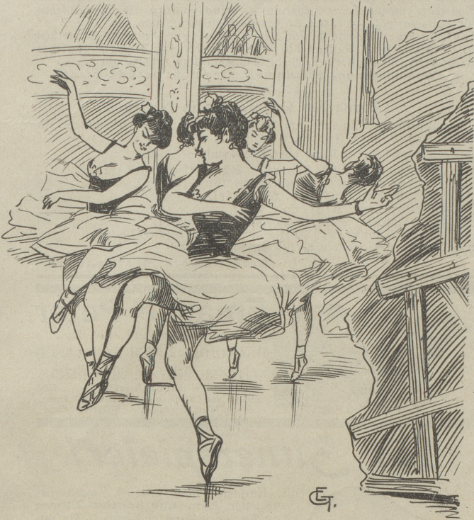
Corps de ballet

Ein wenig anders geschrieben, ein wenig anders getrieben!