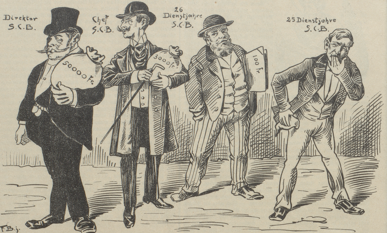
Dä nähmt' i au, dä Abschiedsgrueß, für d'Diräktion e schene Gewinnst, Am leere Doope suuge mueß, der 25-jährig Dienst.