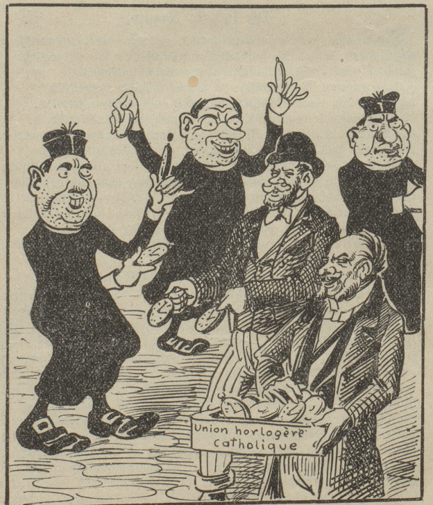
und hier katholische Uhren kaufen, die uns zeigen was die Stunde geschlagen!