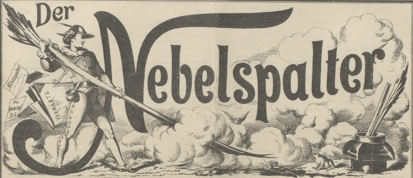
Lith v. Butz & Fleursheimer