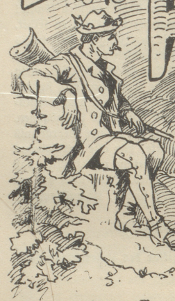
Auf der Fährte.