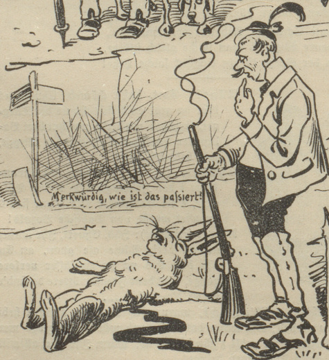
Merkwürdig, wie ist das passiert!

Du Frau, rühr mer au schnell d'Flinte'n abe, 's isch mer gisick hätt öppis vergässe, aber mach weidit, der Zug fahrt mer suscht vor deg Nase furt !!