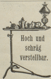
Hoch und schräg verstellbar.

Krankenfahrstühle Klappstühle * Rohrmöbel Rollschutzwände