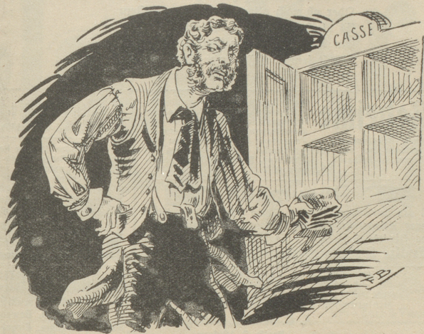
„Geergebrannt ist die Stätte! —“