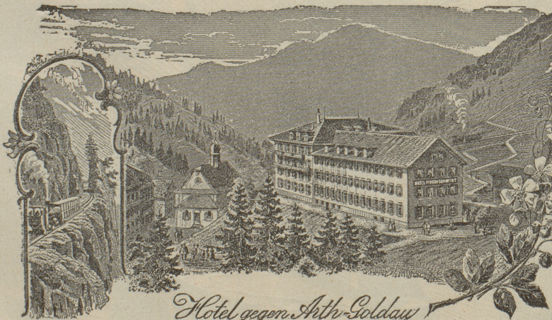
Hotel gegen Arth-Goldau

„Das Klösterli ist der geschütteste Kurort des Rigi, und dennoch entbehrt es in der weiten Mulde der Sonne nicht, ist selten von Nebeln heimgesucht, hat eine milde, sich ziemlich gleichbleibende, keinen grossen Schwankungen unterworfenen Sommertemperatur u. gewährt durch den Anblick der umliegenden grünen Alpweiden, Felsen und Waldungen das freundlich Angenehme eines abgeschlossenen, stillen Bergtales mit köstlicher, reiner, mild-erregender Luft. Der Aufenthalt erweist sich namentlich für sensible, reizbare, noch schwache Rekonvaleszenten, für Lungenkranke von mittlerer Resistenzfähigkeit, für Nervenranke und Geschwächte, welche einer allmählichen anhaltenden Stärkung und Erfrischung bedürfen, als sehr heilsam. — Nahrung, Bäder, Milch, Molken, treffliches Trinkwasser, nahe Waldung mit Ruhebänken und die von den herrlichsten Aussichtspunkten beglückten Spazierziele dienen als erfolgreiche Adjuvantien.“