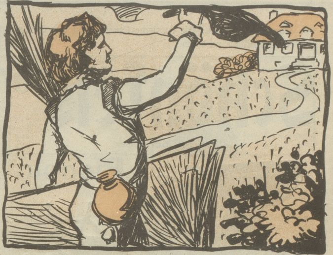
8. Die Flügeltierverwandten. Geister Begrüßen den ent-schulten Meiter: Mach' Freud' uns mit noch manchem Bande! Willkomm, Prophet — im Vaterlande!