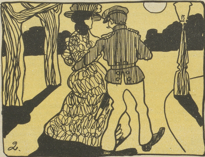
2. Auch Süßholz läßt sich gut versteuern, Wenn Pärchen Stiebesorgen feiern!