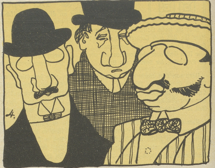
4. Von Riechorganen allzulänglich Gibt's — Hurrah! — Steuern überschwenglich!