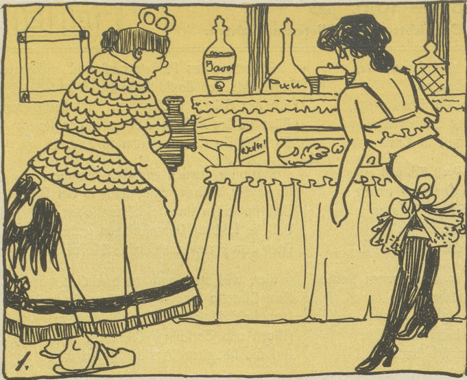
1. Was seh ich? Ha! Obol! Javol! Das kann versteuern man, — jawohl!