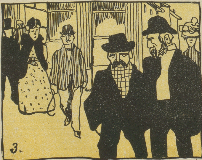
3. Wer heut nicht fliegt, fährt, autorumpelt, Nur auf höchsteig'nen Füßen humpelt, Soll, nicht zu billig, nicht zu teuer, Bezahlen eine Asphaltsteuer.