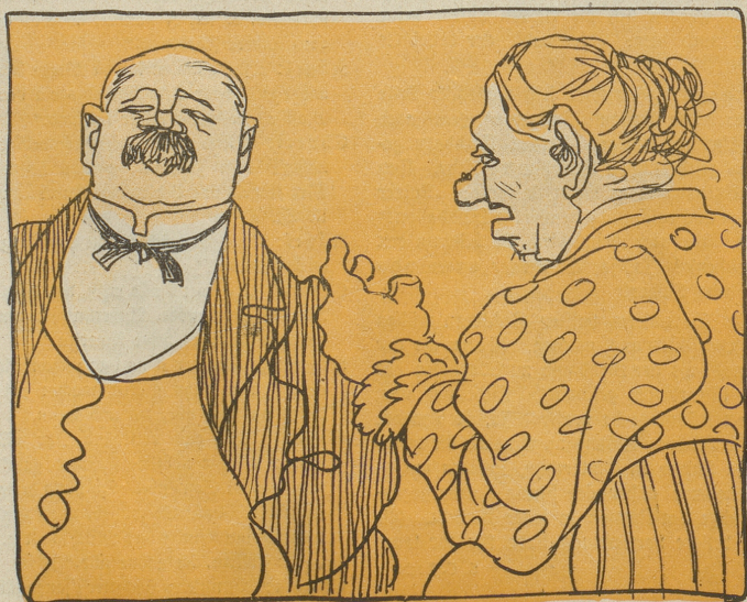
5. ist sie verheiratet heißt sie mancher „Drachen“