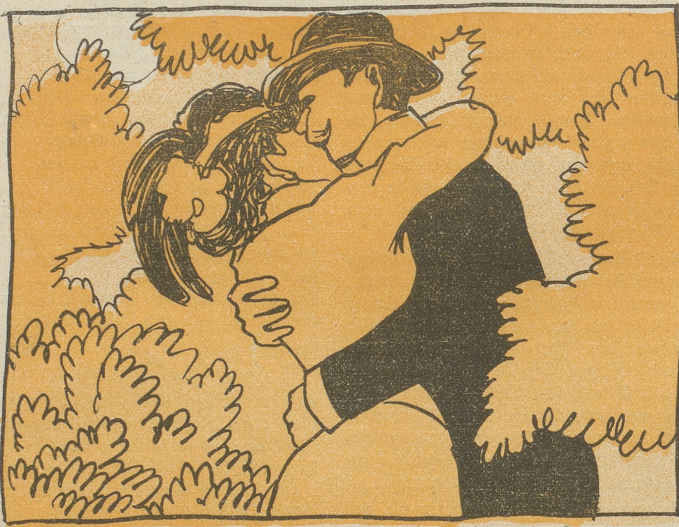
3. ist sie verliebt und verlobt heißt sie „Schatz“.