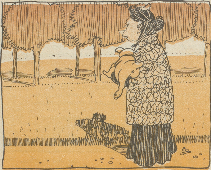
1. Ist sie in einem gewissen Alter noch ledig, heißt man sie „Zumpfere“.