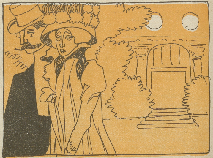
4. ist sie nur verlobt: „Braut“.