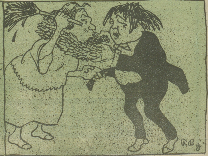
„Mög' der Himmel Dir vergeben, Was Du an mir Armen tust —!“ (Eyonel in Martha.)