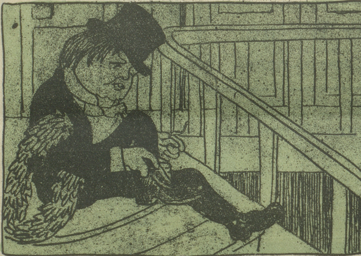
„Am stillen Herd zur Winterszeit“ — — (Meisterfing.)