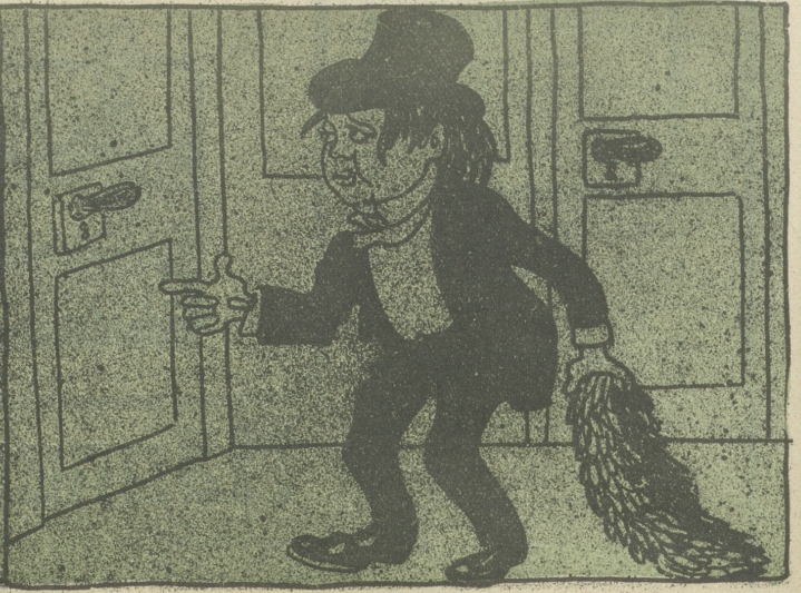
„Da seh' ich noch eine Tür, Vielleicht find ich den Eingang hier!“ (Tamino in der Zauberflöte.)