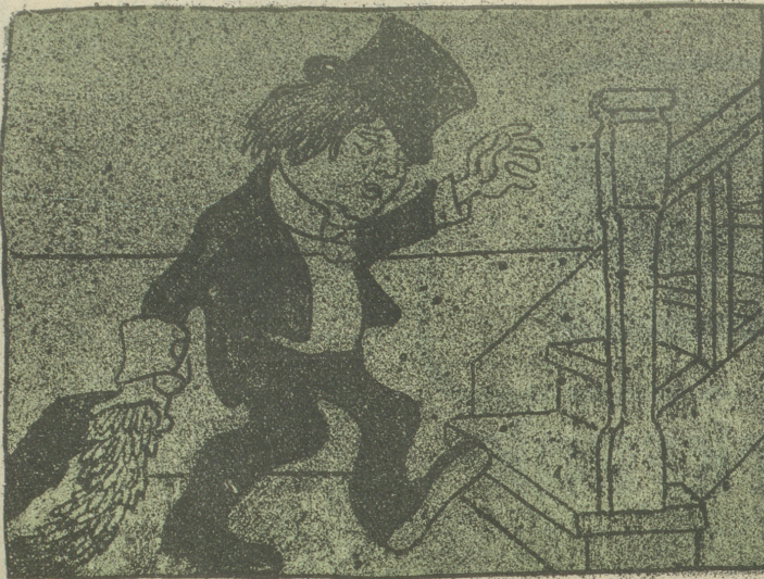
„Gott, — welsch' Dunkel hier!“ (Florestan im Fibello.)