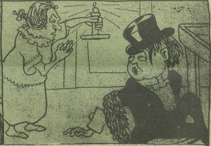
„Lobern zum Himmel seh' ich die Flammen!“ (Troubadur.)