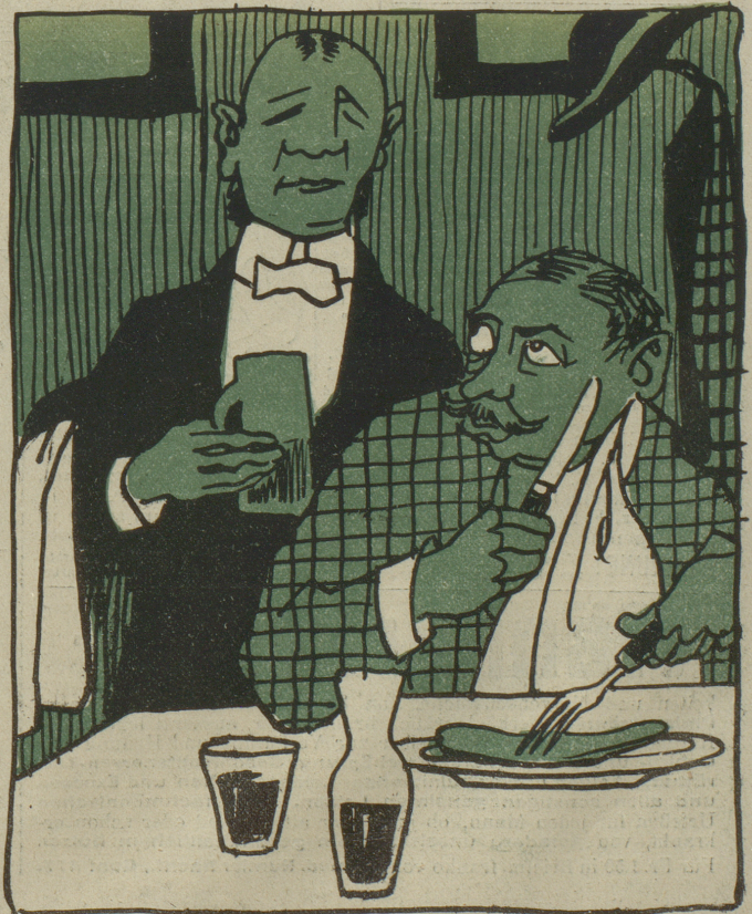
Kellner: Ist das Beefsteak vielleicht etwas zähe? — Gast: Macht nix, ich werde schon fertig damit, ich bin gelernter Bohrer...