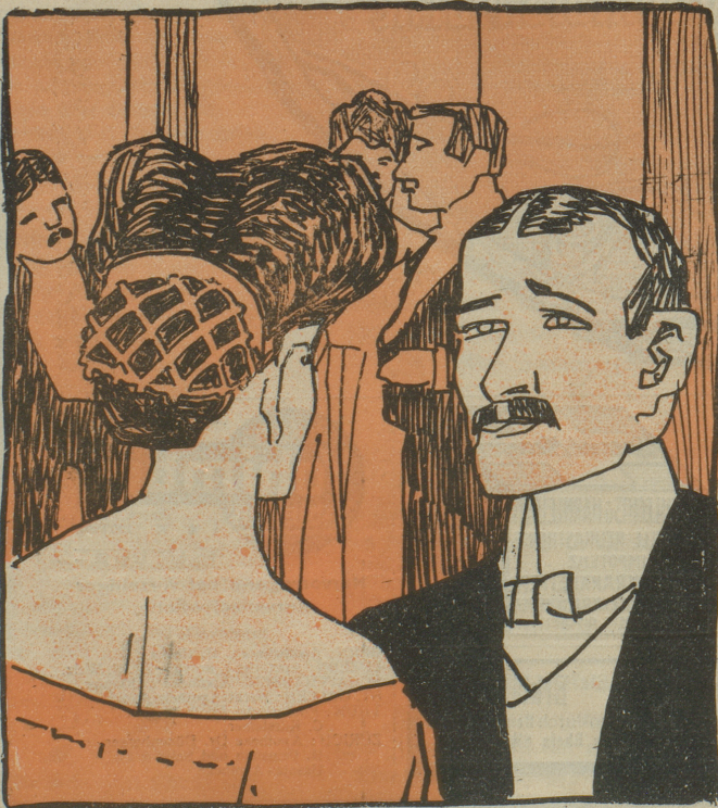
Dame: Ich habe in meinem Leben bis jetzt nur zwei wirklich intelligente Männer gefunden. — Herr: So? Wie heißt der Andere?