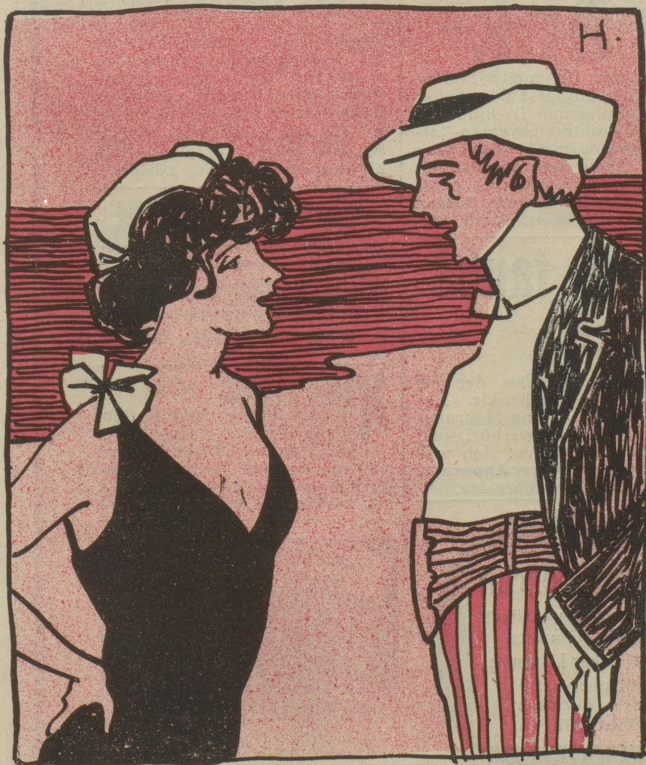
„Mein Fräulein, können Sie gut schwimmen?“ — „Ach, nicht besonders, ich habe es nur oberflächlich gelernt.“