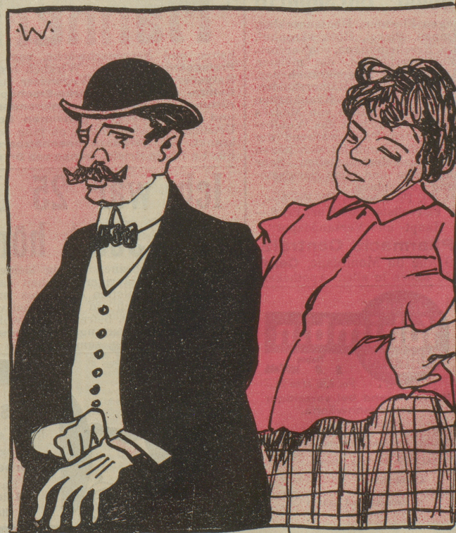
„Aber Mann, Du bist ja das reine Zündhölzchen.“ „Ich, wieso denn? — Na, Du gehst auch immer aus wenns regnet.“