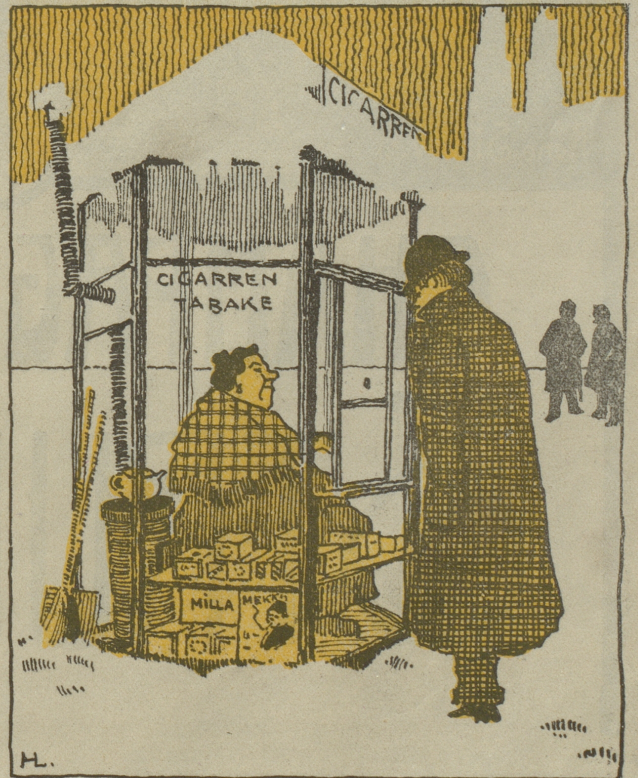
Als Ersatz für die bisherigen „Zigarrenläden“ empfiehlt ein Sittlichkeitsverein die Errichtung von besser beleuchteten Verkaufsstellen, die sowohl der öffentlichen Moral, als auch der Einigkeit zwischen dem zürcherischen Stadtrat und dem Statthalteramt zugute kommen würden.