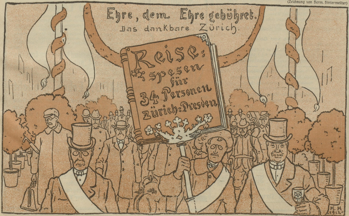
An die Hygiene-Ausstellung in Dresden sind 34 zürcherische Beamte abgeordnet worden. Sie haben als einzige Berichterstattung ihre Speiserechnungen eingereicht.