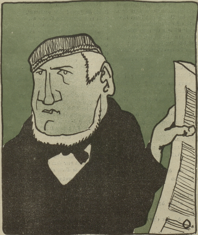
Da heißt Optimist, dann wieder Pessimist; das ist sicher wieder so ein neuer Kunstdünger. Ich bleibe beim Kuhmist!