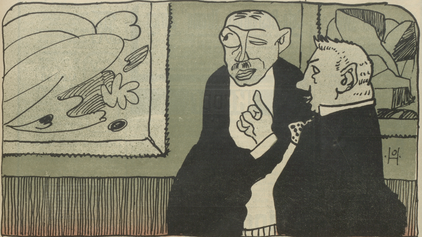
„Aber Herr Doktor, das ist doch ein schreckliches Bild!“ — „Ja, wissen Sie, das ist auf Entfernung berechnet!“ — „Dann bitte, entfernen Sie es doch recht bald!“