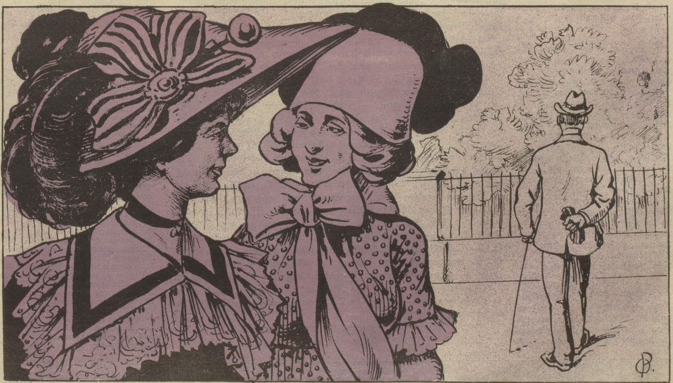
Du Bisy, steh nur den Herrn dort an, wie plump er in seinen Bewegungen ist. — Ja wirklich, und verheiratet ist er auch schon . . .