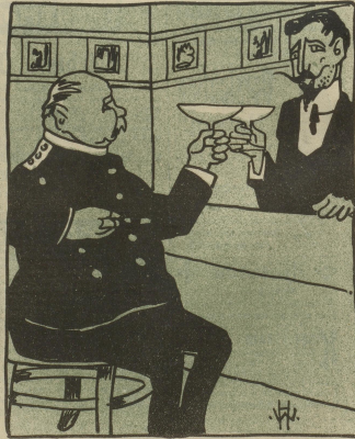
Mon ami, nous vous donnent 100 vaggons a livrer. (Darauf findet sich absolut kein Reim.)