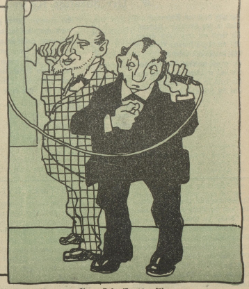
Wenn Sie Submissionspreis um \frac{1}{4} Frank reduzieren, können Sie uns 50 Wagen Häfer Nr. 15 zuführen.