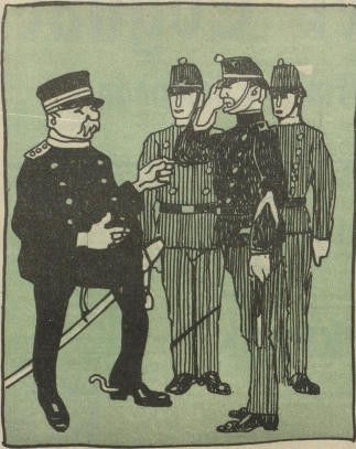
Wollen Sie uns gel. Heuofferten unterbreiten. (Ich will das Andere schon in die Wege leiten.)