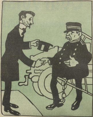
Mon ami le colonel X est toutes les années mon hôte. (Dafür aber macht man ihm das beste Angebot.)