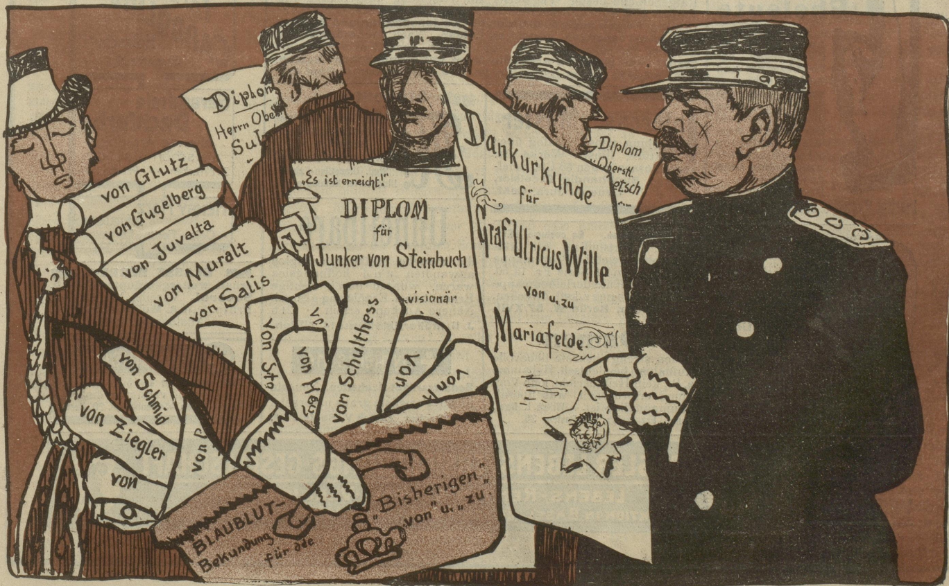
Neue Zürcher Nachrichten No. 216: „Schweizerische Militärpersonen dürfen keine Orden annehmen; der Kaiser läßt ihnen daher künstlerisch ausgeführte Ehrenurkunden überreichen.“