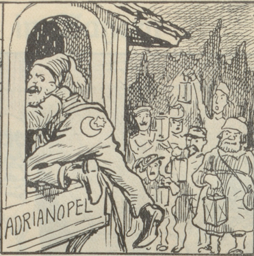
Ein Wohnungseinschleicher vor den Augen der Wach- und Schließgesellschaft