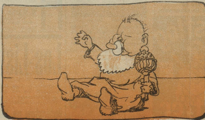
Der Kleinste geht, sobald er kann.