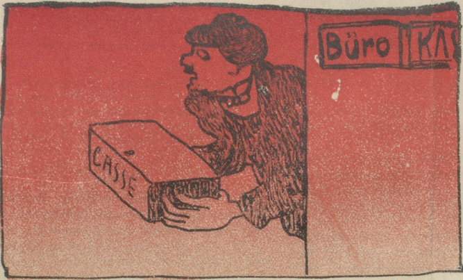
Der Vater geht mit fremdem Geld.