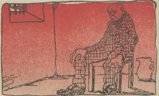
Der Vater sitzt, o jemine!