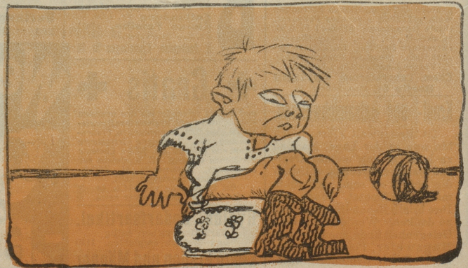
Der Kleinste sitzt noch auf dem Topf.