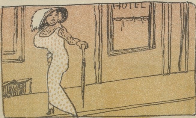
Die Mutter geht, bis man sie stellt.