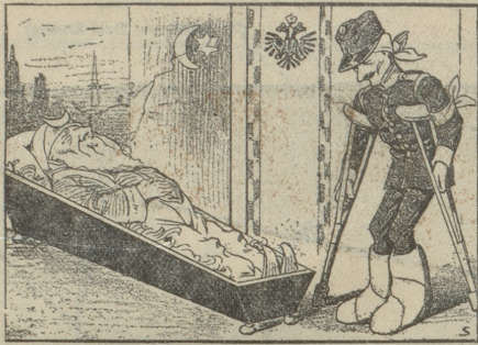
Das Ende des Balkanrieges Der „kranke Mann“ ist tot, es lebe der „kranke Mann“!