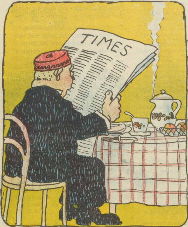
1. Morgens: Beefsteak (engl.), russischer Tee. „Times“.