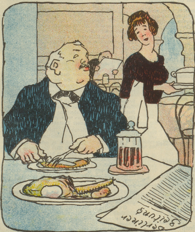
3. Abends: Frankfurterli oder Wienerli (echt) mit Sauerkraut. Münchner Bier. „Berliner Tageblatt“.