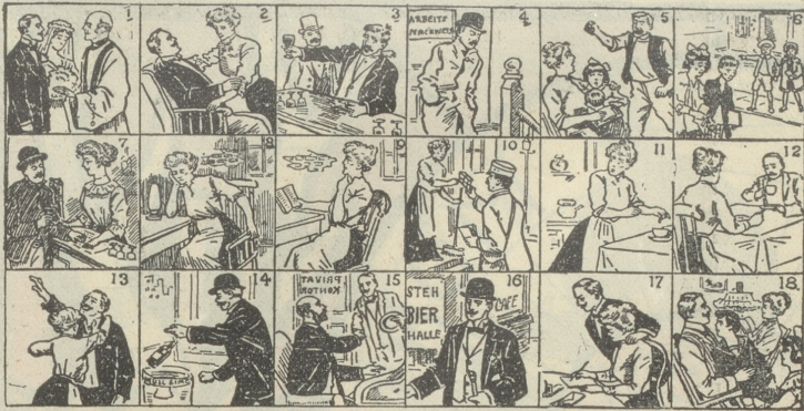
Diese 18 Bilder erzählen eine ganze Geschichte. Ein Kind kann sie verstehen.