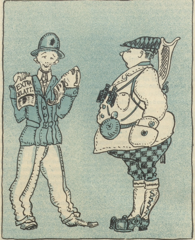
Wohin kauft denn du für was Geld, fidi? Kü, ich verkaufe Landsturmzeitung!