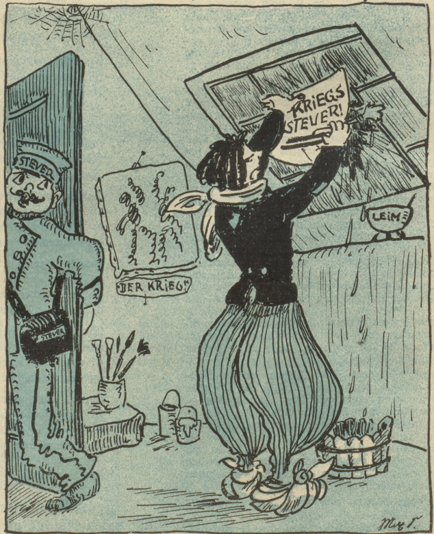
Max hat: „Dass ich habe ich gerade noch genommen!“