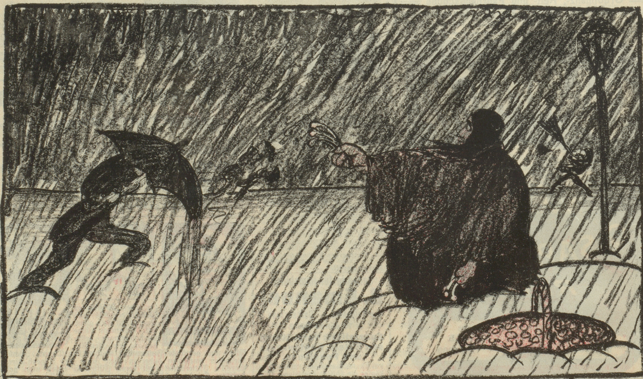
„Schön san's, Herr! Die ersten Frühlingsboten!“