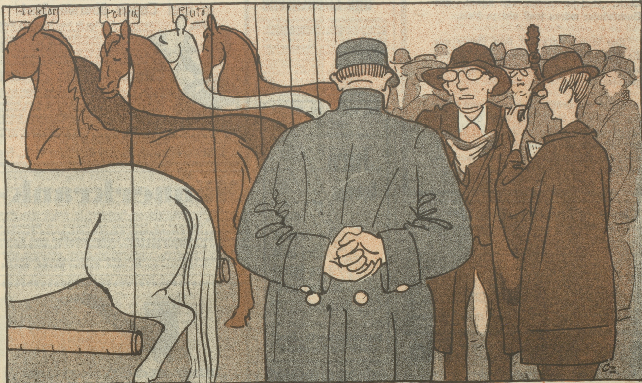
Im Pferdestall: „Aber — äh — sagen Sie, wo sind denn nun hier die — äh — grünen Pferde?“