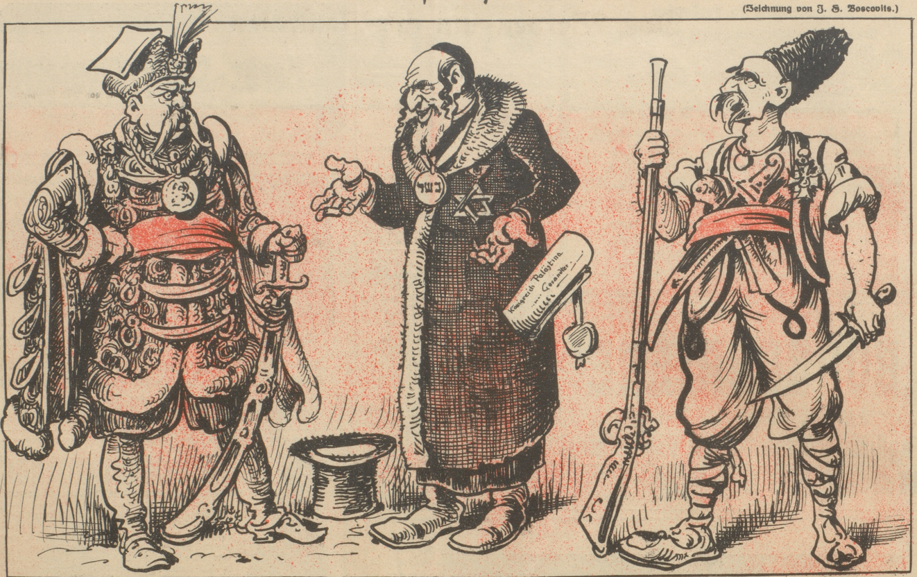
Der Weltkrieg hat also doch einen Zweck gehabt. Er verarmte die Welt um Menschen und bereicherte sie um — Diplomaten.