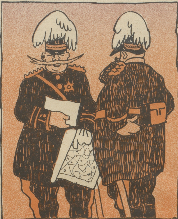
„Das fehlt uns gerade noch, daß die Leute in den Schützengräben anfangen, uns im Komödiepielen Konkurrenz zu machen.“

Ein französischer Opernsänger sang längst aus seinem Schützengraben den Deutschen die Gralseerzählung vor.