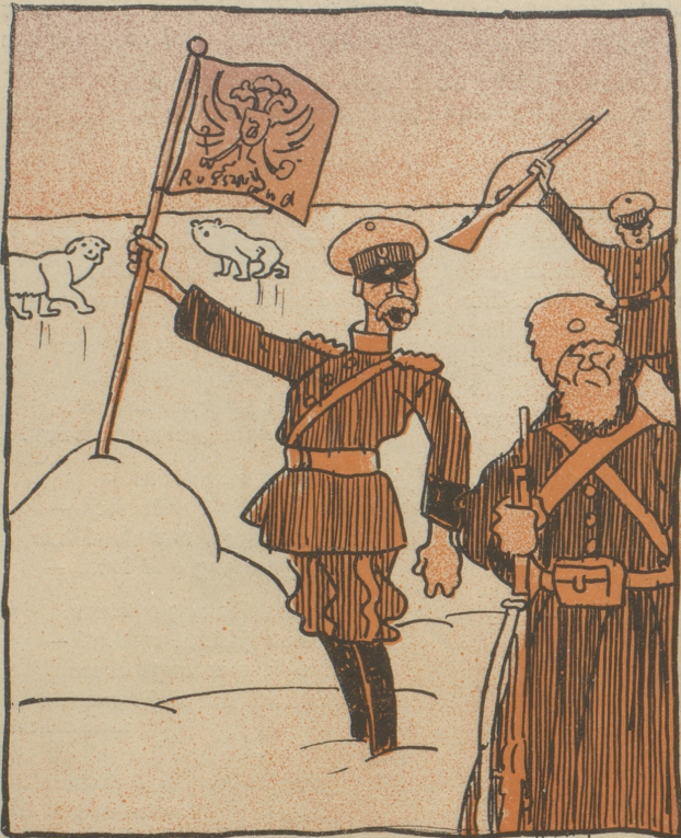
„Endlich haben wir Ersatz für das verlorene Polen.“

Das bisher österreichische Grenz-Josefsland am Nordpol wurde von den Russen besetzt.