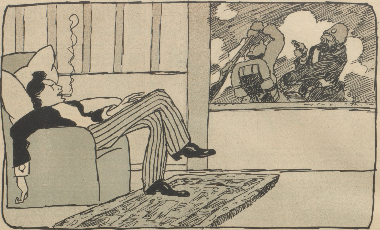
Der „ruhende Pol“ in der Erscheinungen Schlacht.