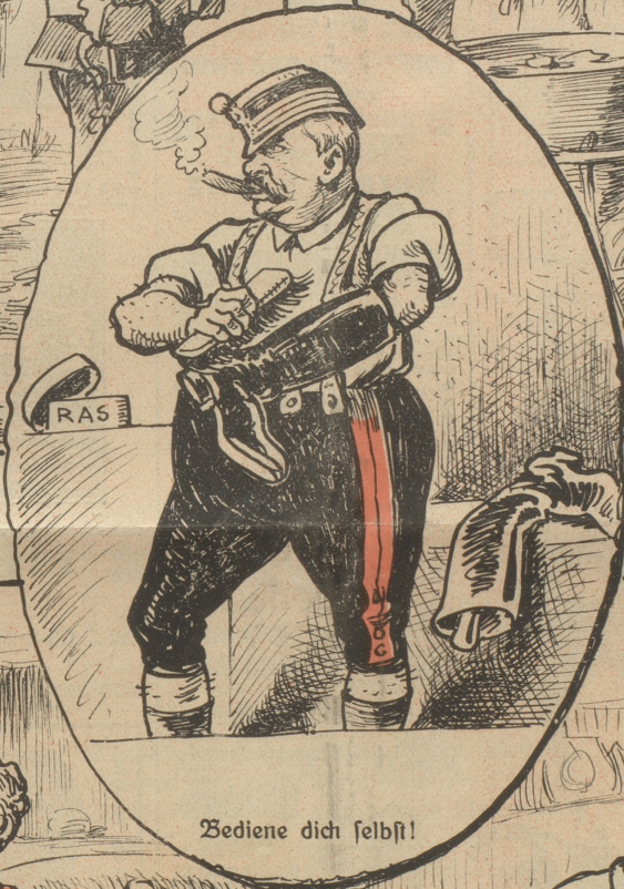
Bediene dich selbst!