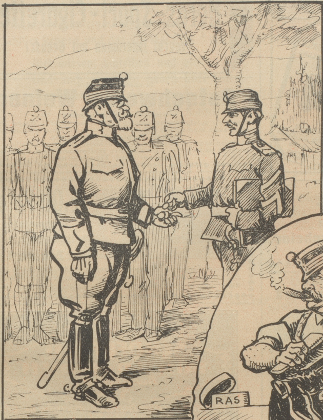
„Sehn Lage à 80 Kappen macht acht Stranken, Herr Oberst.“