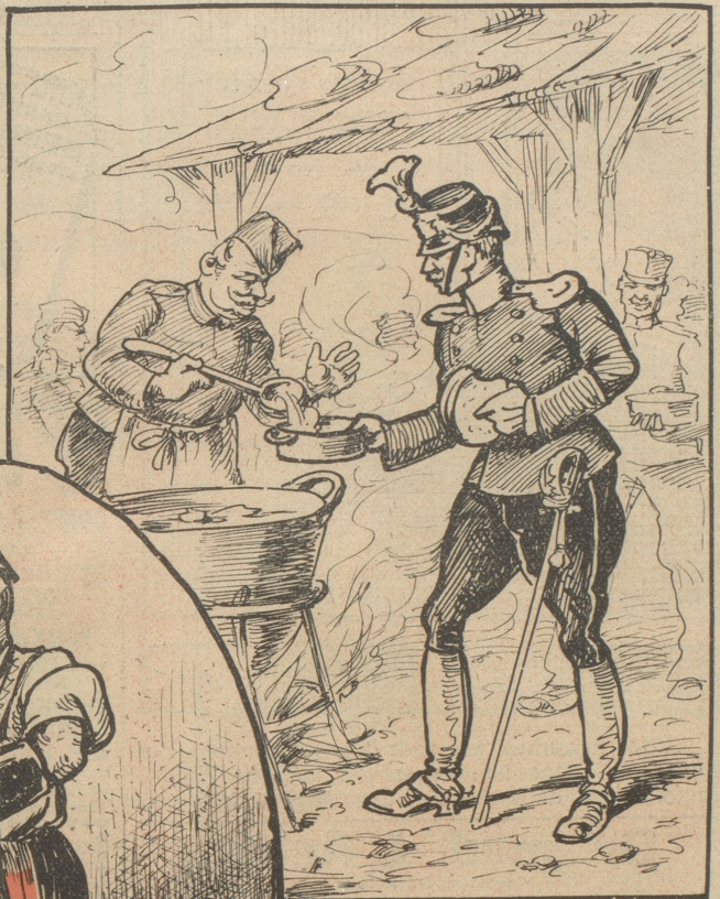
Der Leutnant beim Sassen.