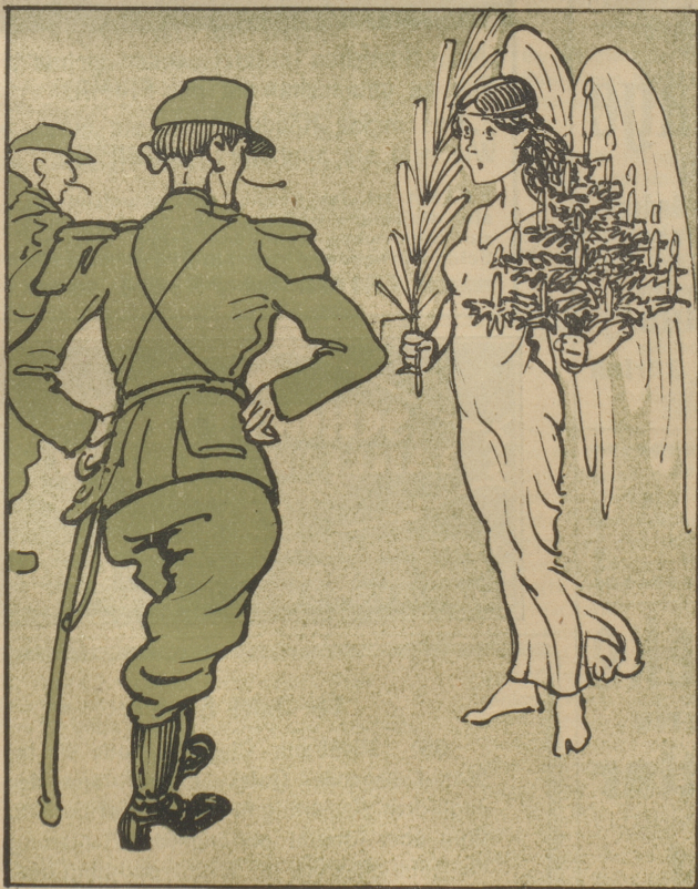
„Fräulein, was wollen Sie denn hier mit dem Gebüsch? Haben Sie überhaupt Ausweis?“