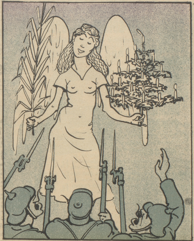
Friede auf Erden, Halleluja! Das Echo: Hurra! Hurra!