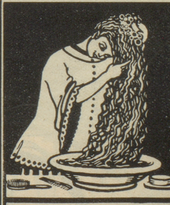
Kopfwashungen mit Grollichs Heublumenseife entfernen Schuppen, stärken den Haarboden und machen das Haar voll und wellig.

Mütter! Wascht Eure kleinen Lieblinge mit Grollichs-Heublumenseife und auch Ihr werdet Euch an deren Gesundheit und rosigen Aussehen erfreuen. Grollichs-Heublumenseife ist in allen Apotheken, Drogerien, bei den Gärtnern, sowie in allen Konsumgeschäften zu haben. Man bitte sich vor Nachahmungen und nehme nur solche Heublumenseife, die aus Brünn stammt und Grollichs-Bild und Namen trägt. Mit einer gefälschten Heublumenseife würdest Du, lieber Leszer, diese Erfolge nicht erzielen. Nur Grollichs-Heublumenseife aus Brünn ist eine Gesundheits- und Schönheitsseife sans rival.