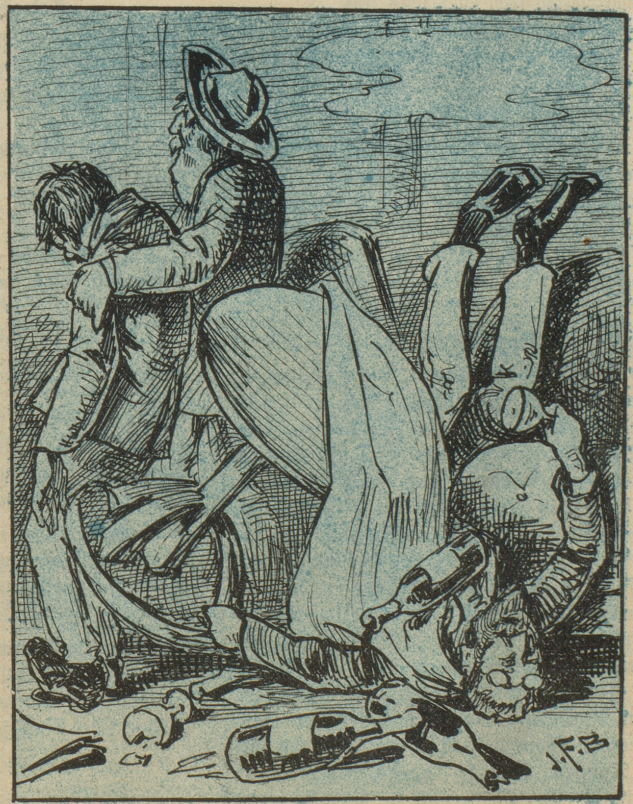
„Endlich ist der Feind in die Blucht geschlagen. Aber auch ich liege schwer darnieder.“