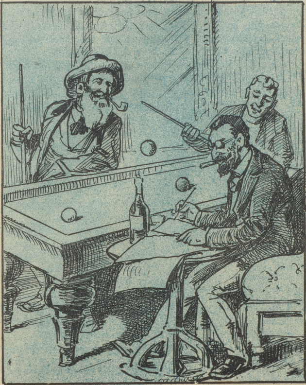
„Ich schreibe diesen Bericht mitten im Gemüth des Kampfes, während mir die Kugeln um die Ohren fliegen.“