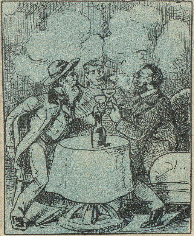
„Ein eigentümliches Klingen läßt sich mitten im Geräusche der Schlacht hören. Wir sind in furchtbaren Dampf eingehüllt.“