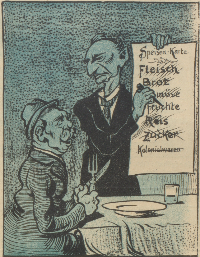
Grey führt ihn auf Grund der Speisekarte.