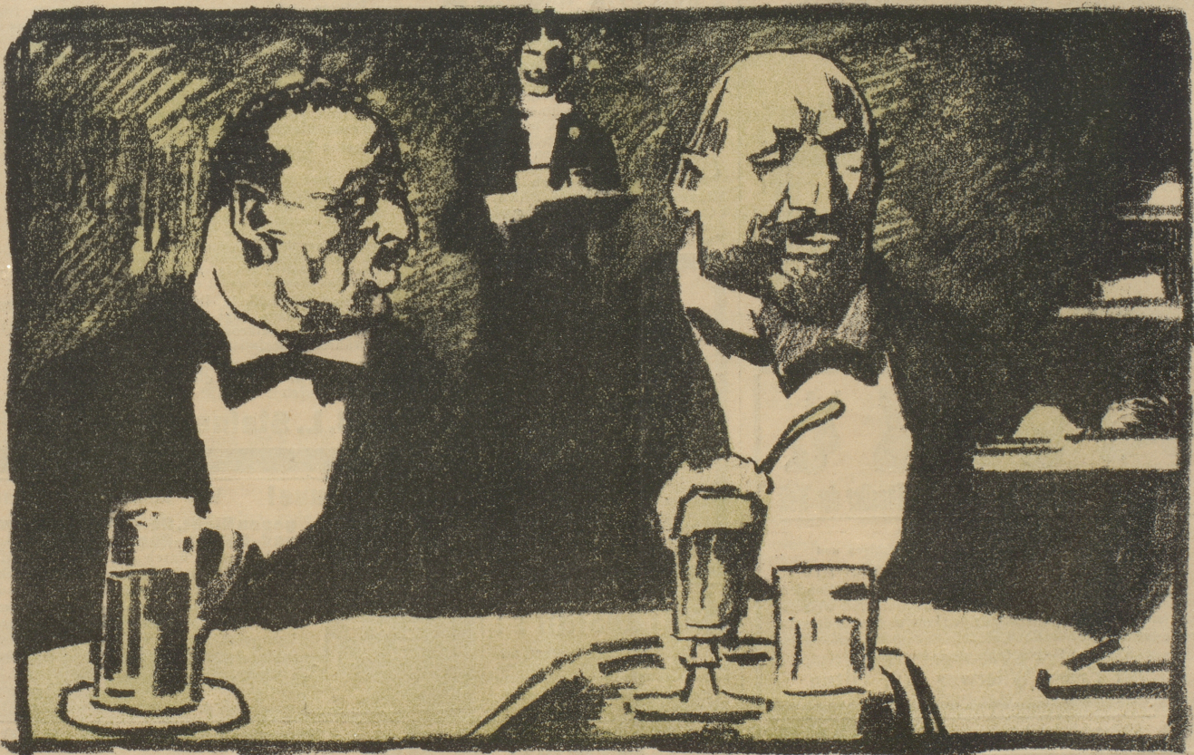
„Was gehen uns die Berichte an — unser Weizen blüht.“