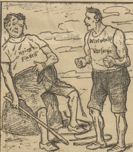
die Haut zu Leder.