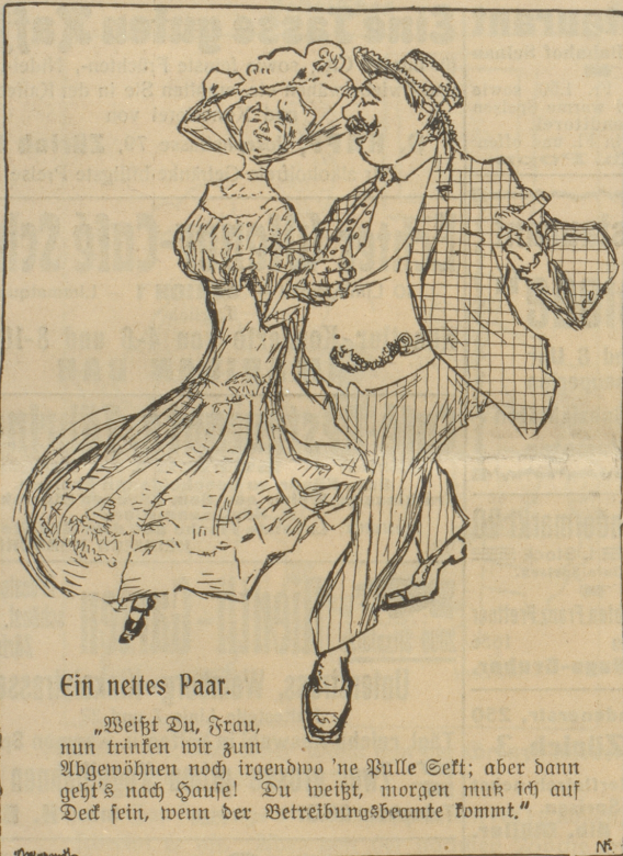
Ein nettes Paar.

„Weißt Du, Frau, nun trinken wir zum Abgewöhnen noch irgendwo 'ne Kulle Sekt; aber dann geht's nach Hause! Du weißt, morgen muß ich auf Deck sein, wenn der Betriebsbeame kommt.“