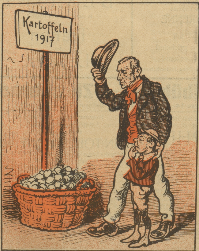
„Büebli, zieh's Hüetli ab, das sind Höröpfel.“