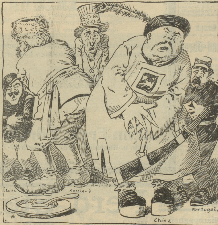
Ob sie die Kost auf die Dauer vertragen?